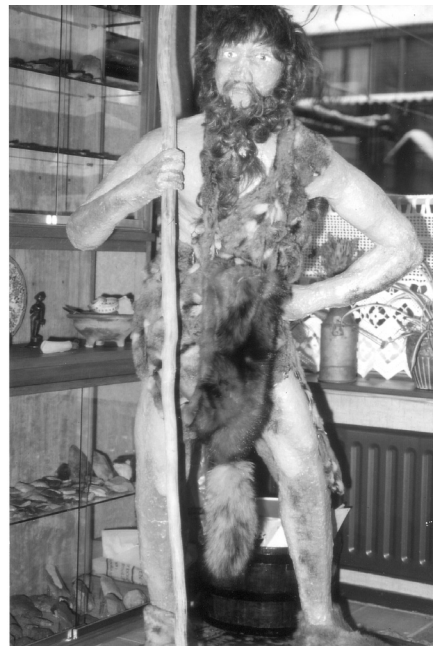
'Durk' de Neandertaler.

Daar sta je dan met al je publiciteit en met je gewekte verwachtingen! Er viel niets meer af te zeggen. Moeder Kerkhof liet zich niet meteen uit het veld slaan. Ze pakte het telefoonboek van 's-Hertogenbosch en begon voor de voet alle Van der Lee's